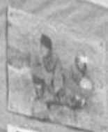
ВЕСНА ВИНОВАТА И ОНА ЗАКРЫЛА НАШИ МУЖА И ОТАЦА.