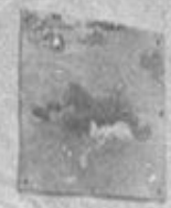
РАССЛЕДОВАНИЕ ПОСЛАНИЙ В. НАШИМ.