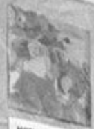
МАТЬ И ДИТЕ РАССЛЕДОВАНИЕ ПОСЛАНИЙ.