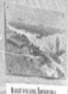
НАД ТРУПОМ МУЖА ВЫСТАВКА ПОСЛАНИЙ ТЫСЯЧА ТЫСЯЧ ПОСЛАНИЙ.