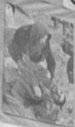
НАД ТРУПОМ МУЖА.

СЕМЬ ТЫСЯЧ ВОЗРАЖАЮЩИХ ПОСЛАНИЙ ПОСЛЕ РАССЛЕДОВАНИЯ СОВЕТСКОГО ВЕЩАТЕЛЯ