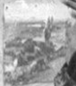
НАД ТРУПОМ БЛИЗКОМУ

ФАШИСТСКИЕ МЕРЗАВЦЫ ДОЛЖНЫ БЫТЬ ИСТРЕБЛЕНЫ - ТАКОВА ВОЛЯ НАРОДА